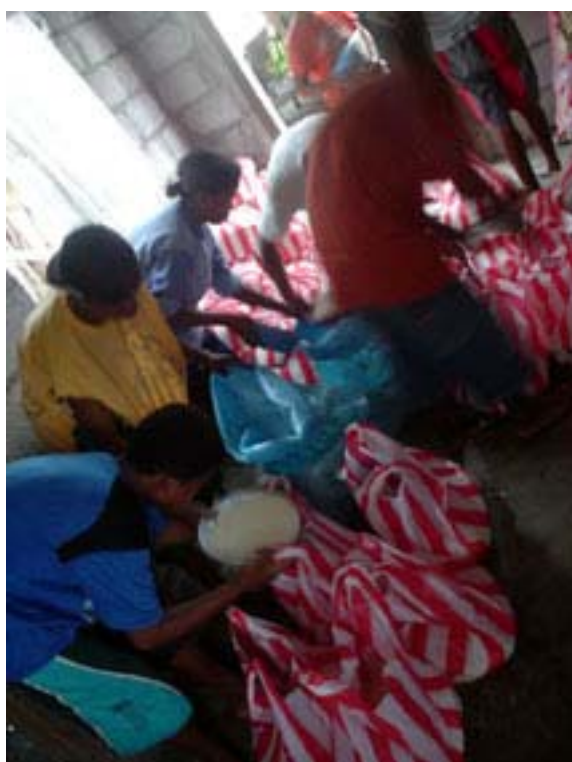
避難先のパラヤン集落での食糧配給の様子(9月)

4月の集落での問題発生を受けて、急遽実施したのが本活動です。避難を余儀なくされたアエタ族住民は、避難先では仕事も収入も無い状態が続きました。そこで、住民への直接の支援となる米・医薬品の配給と、住民が集落に復帰できるための行政との交渉の2つの活動を実施してきました。山間部での問題でアエタ族という状況から、当初は行政の支援もほぼ無い状況が続いていましたが、当会と住民のリーダーの頻繁な要請により、本年後半になってようやく行政の対応も始まり、現在は集落へ住民を戻す調整が行政内で行われています。本年度中の住民の集落への復帰という解決を目標に交渉を行ってきましたが、行政内での手続きの遅れ等があり、次年度まで持ち越す結果となっています。