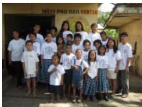
新しい制服を着た生徒たち

センターの運営に問題が発生したため、急遽実施した本プロジェクトですが、上記の様な活動により、本センターで生活する児童たちが施設の問題の影響を受けることなく、例年と同様に学業を継続することが可能となっています。