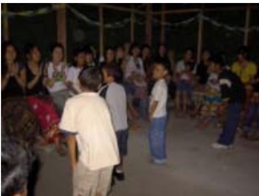
整備後の ECCD クラスでのさよならパーティ

提携団体のタタッグは、支援地域内で ECCD ( Early Child Care Development ) という就学前の児童への学習補助プログラムを実施していますが、地域によっては会場が無いために野外での活動となっていました。そこで、この ECCD が実施されている地域の一つであるマバユアンにおいて学習センターの整備を実施しました。作業はワークキャンプ参加者と地域住民が担当しました。