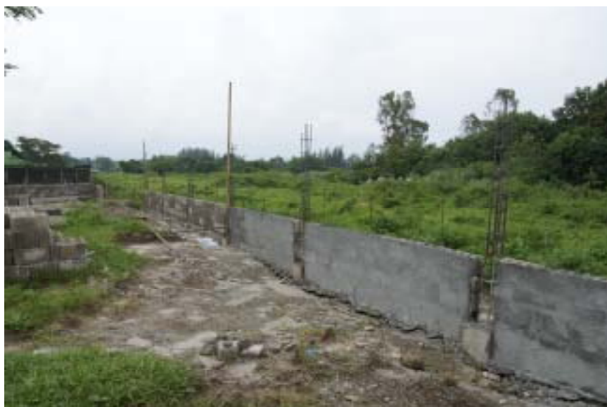
* 設置中の壁の様子