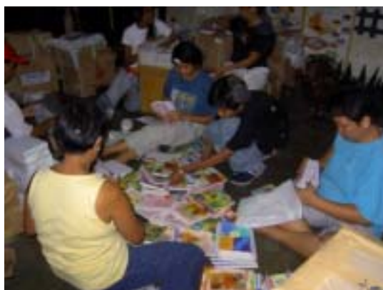
こどもたちに配る文房具の仕分けをするお母さんたち