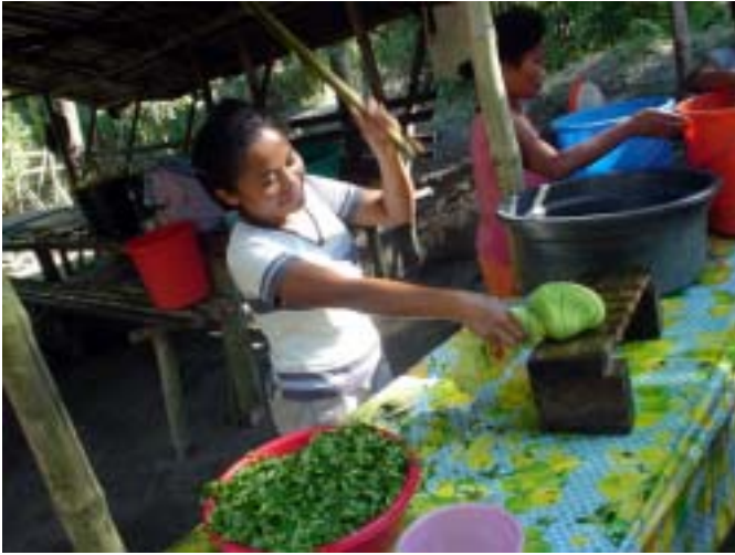
平地で活動を再開したハーブ石鹸作成の様子(11月)