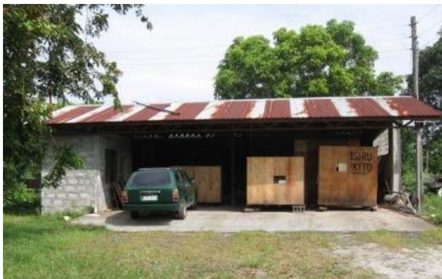
* ジャイラホームに届いた機材と、店舗への改装を予定している資材小屋