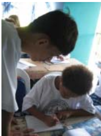
数学の時間勉強をする生徒と アシスタントティーチャー