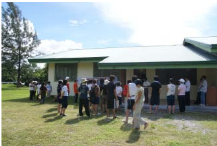
* 事務所棟オープニングの様子

本年9月に改装が完了し、建物のオープニングを終えました。現在は Philippine Faith Mission Inc. JIREH HOME, ACTION 三団体の事務所のほか、ミーティングルーム、図書室、パソコン室、ACTION 駐在職員用の居住室を備えています。今後はジャイラホームやACTIONの活動の拠点として活用されるとともに、こどもたち向けの日本語教室等としても使用する予定です。