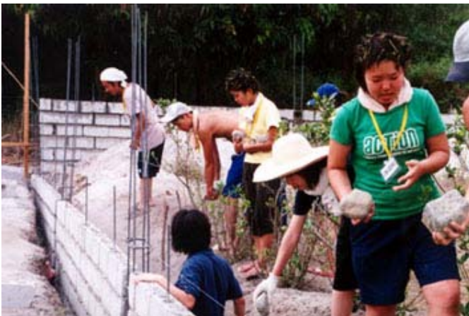
フェンスの取り付け作業を行うワークキャンプ参加者(2月)

集落での問題発生前であったため、計画に影響を受けることも無く、2月から3月末にかけて作業を実施。順調に小学校へのフェンス取り付けが完了しました。しかし、続いて8月のキャンプ時に実施する予定であった校舎の補修に関しては、問題の影響を受けたため、実施を延期することとなりました。来年度8月に実施することが計画されています。